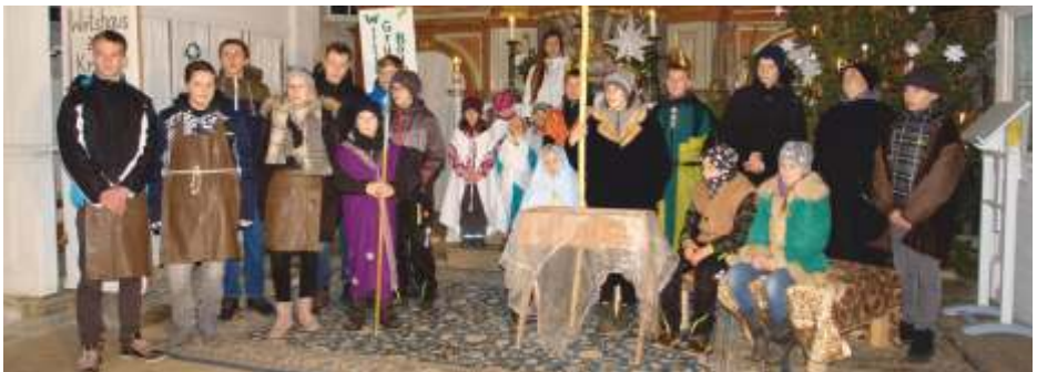
Krippenspiel in Frankenstein

Danke-Schön für 878,42 € Spenden für „Brot für die Welt“ und 570 € für Kinder in Lateinamerika, die die Sternsinger gesammelt haben und für 45 kg Stifte, die Mädchen in Flüchtlingslagern im Libanon stark machen.